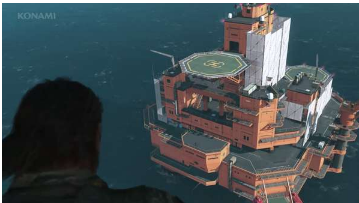
Le Boss arrive à sa base Op

Réussir une mission, principale ou secondaire, t'apporte plein de choses : de la thune, des ressources matérielles, minérales, botaniques (si), mais aussi des prisonniers à convertir à la bonne cause et beaucoup d'autres trucs : des armes lourdes, des véhicules, des animaux pour ta basse-cour (si, si), etc. Tout cela va te permettre de construire, développer et faire vivre ta base Opérations, la Mother Base , une plateforme pétrolière reconvertie.